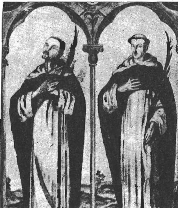
Aita Domingo Erkizia Lete eta Aita Mikel Aozaraza Garibai oiñatiarra santu