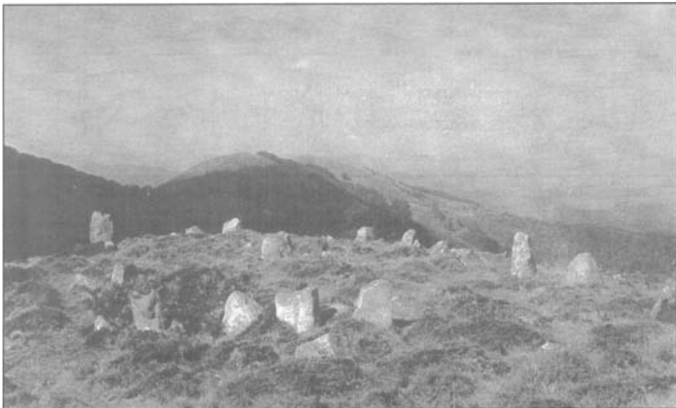
Cmnilec h (Euskalerrri) (Altuna).