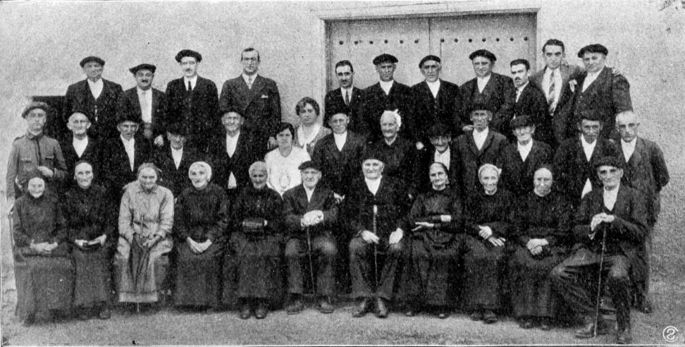
Etxebaria (Markina). Agintariekaz eskola-umiek ordainduta bazkari bat artu dabən eřiko zařak